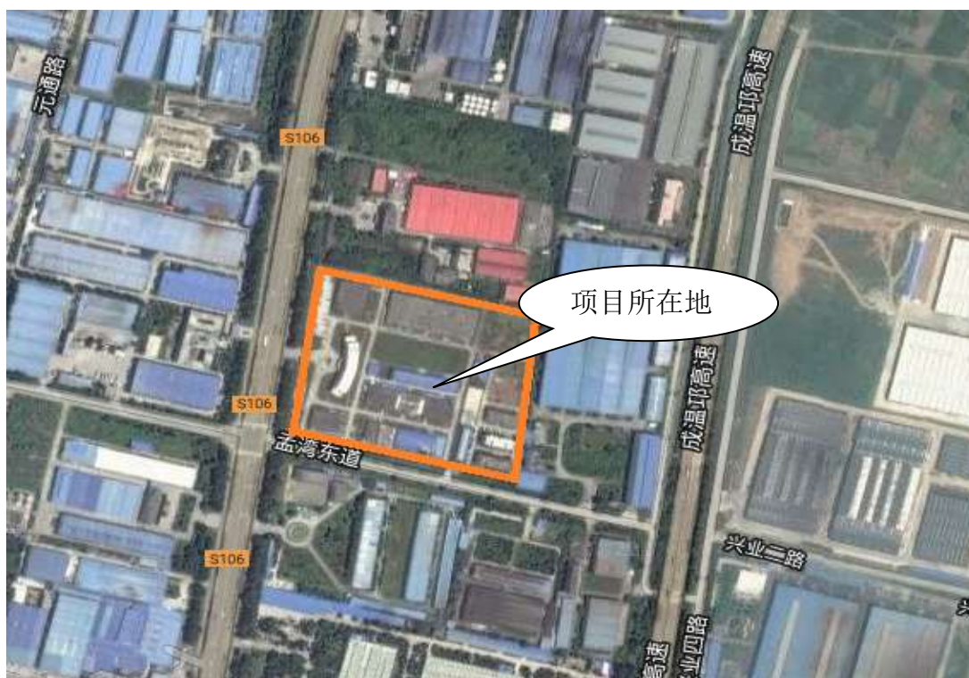
图 2.3-1 成都圣诺生物制药有限公司卫星地图